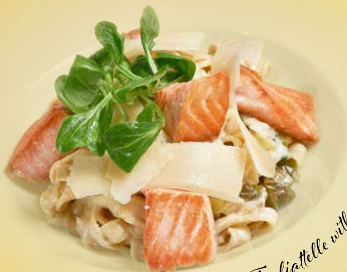
Tagliatelle with grilled salmon