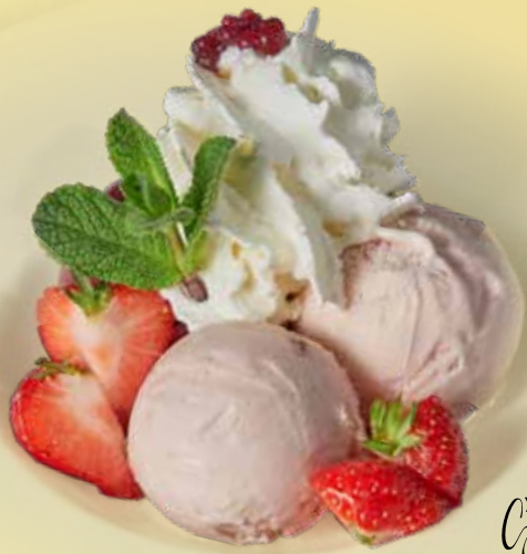
Strawberry ice cream