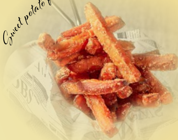
Sweet potato fries

Side dishes and ingredients / Beilagen und Zutaten