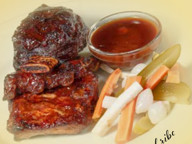
Grilled pork and beef ribs

Pikantní kuřecí křídélka s kořenovou zeleninou a sladkokyselou omáčkou Spicy chicken wings with root vegetables and sweet and sour sauce Würzige Hähnchenflügel mit Wurzelgemüse und süß-saurer Sauce Alergeny/Allergens/Allergene 1, 7, 9 359 CZK