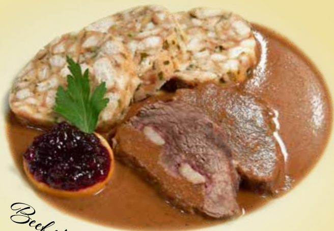
Beef sirloin in cream

Hovězí svíčková na smetaně s karlovarským knedlíkem a brusinkami Beef sirloin in cream with Carlsbad dumplings and cranberries Lendenbraten vom Rind auf Sahne, mit Karlsbaderknödeln und Preiselbeeren Alergeny: 1, 3, 7, 9, 10 359 CZK