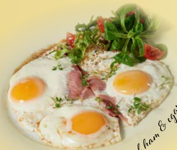
Traditional ham & eggs

Tradiční ham & eggs ze 3 vajec Traditional ham & eggs of 3 eggs Ham & Eggs auf traditionelle Weise, mit 3 Eiern Alergeny/Allergens/Allergene 3, 7 160 CZK