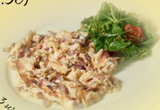
3 scrambled eggs

3 míchaná vejce se slaninou a cibulkou 3 scrambled eggs with bacon and onion 3 Rühreier mit Speck und Zwiebel Alergeny/Allergens/Allergene 3, 7 160 CZK