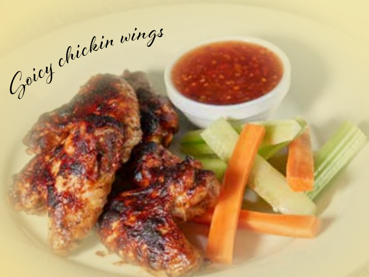
Spicy chicken wings

Pikantní kuřecí křídélka s kořenovou zeleninou a sladkokyselou omáčkou Spicy chicken wings with root vegetables and sweet and sour sauce Würzige Hähnchenflügel mit Wurzelgemüse und süß-saurer Sauce Alergeny/Allergens/Allergene 1, 7, 9 359 CZK