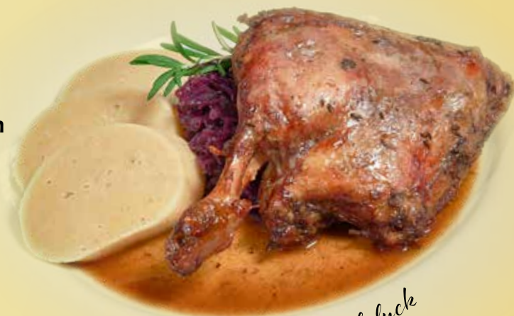
Confit of duck

Konfitované kachní stehno s bramborovým knedlíkem a červeným zelím Confit of duck leg with potato dumplings and red cabbage Konfierte Entenkeule mit Kartoffelknödel und Rotkohl Alergeny: 1, 3, 7 379 CZK