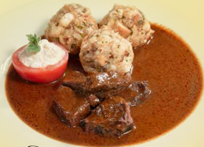
Traditional beef goulash

Tradiční hovězí guláš, se špekovým knedlíkem a jablečným křenem Traditional beef goulash with speck dumplings and apple horseradish Traditioneller Rindergulasch mit Speckknödeln und Apfelmeerrettich Alergeny: 1, 3, 7 359 CZK