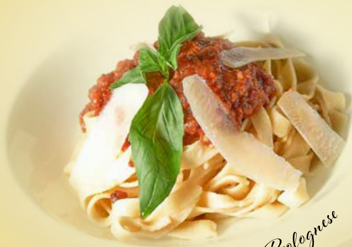
Tagliattelle ala Bolognese