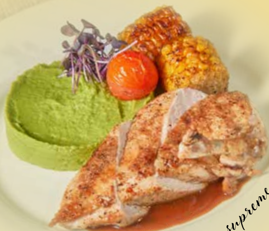
Grilled chicken supreme

s hráškovým pyré a kukuřičným klasem Grilled chicken supreme with pea puree and corn on the cob Gegrilltes Hühnerfleisch mit Erbsenpüree und Maiskolben