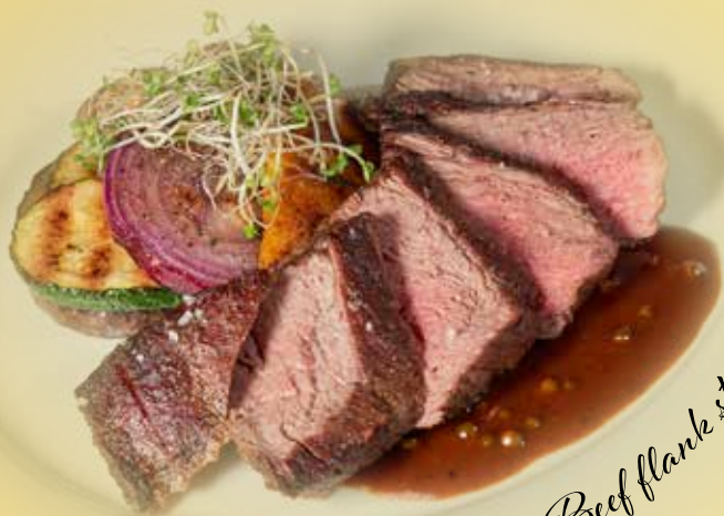
Beef flank steak

US hovězí flank steak s grilovanou zeleninou a pepřovou omáčkou US beef flank steak with grilled vegetables and pepper sauce US-Beef Flanksteak mit gegrilltem Gemüse und Pfeffersauce Alergeny: 1, 6 450 CZK