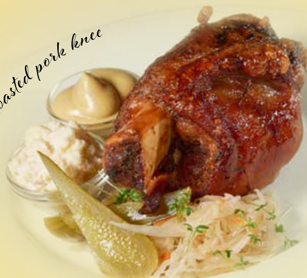
Roasted pork knee

Grilovaná vepřová a hovězí žebra s BBQ omáčkou a nakládanou zeleninou Grilled pork and beef ribs with BBQ sauce and pickled vegetables Gegrillt Schweine- und Rinderrippen mit BBQ-Sauce und eingelegtem Gemüse Alergeny: 1, 9, 10 399 CZK