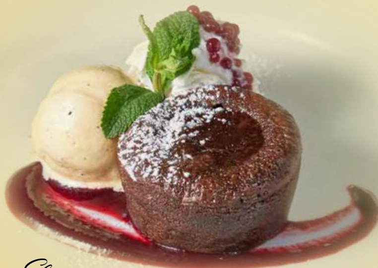
Chocolate fondant with vanilla ice cream