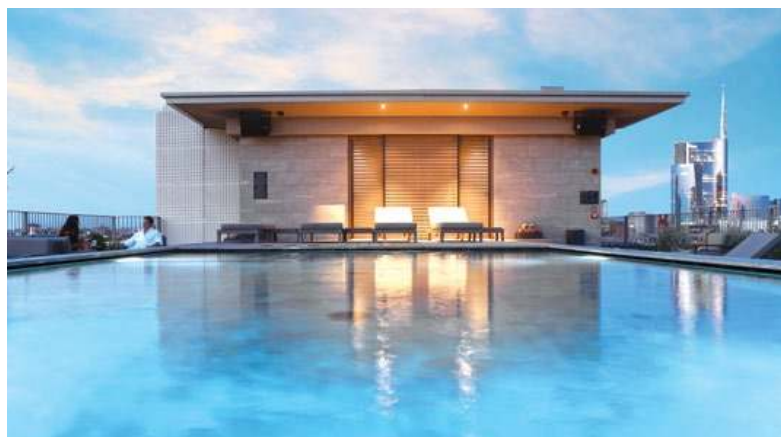
HOTEL VIU MILAN - MILANO