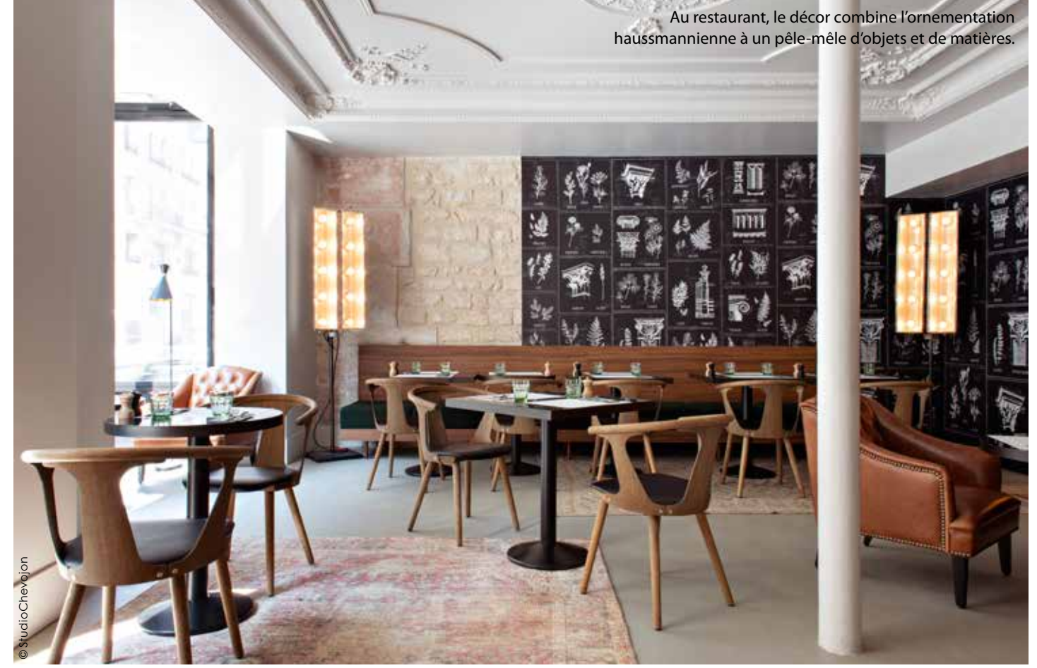
Au restaurant, le décor combine l'ornementation haussmannienne à un pêle-mêle d'objets et de matières.