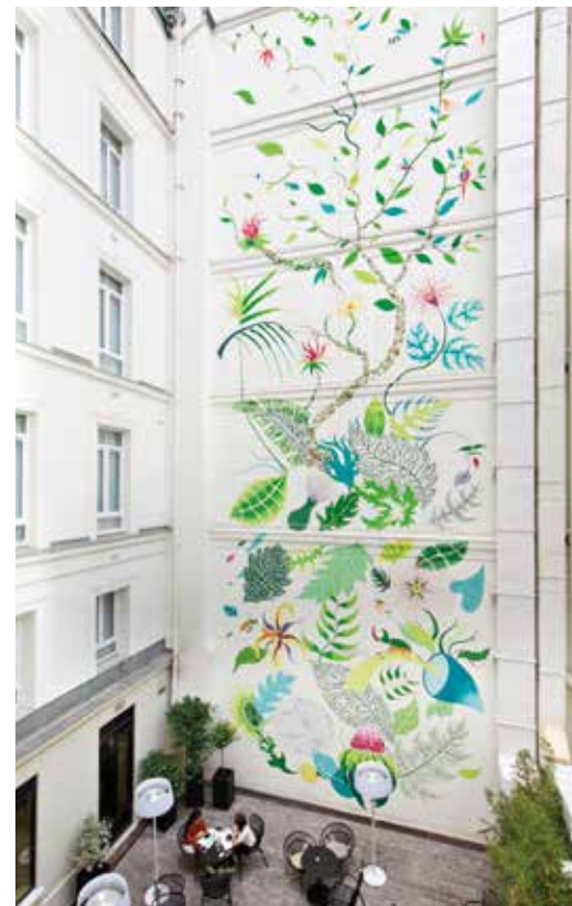
COUR INTÉRIEURE _ Elle cultive l'esprit champêtre du lieu avec une fresque géante de fleurs, œuvre du street artiste Gola Hundun. À l'abri de la frénésie du quartier, elle est idéale pour prendre un verre.