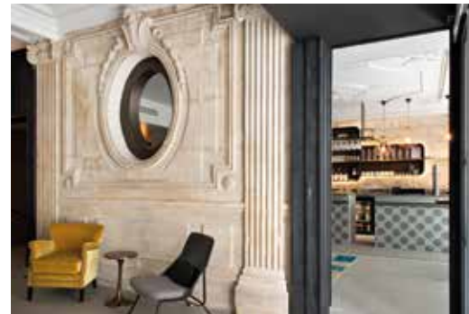
ENTRÉE _ La pierre blonde typique des immeubles haussmanniens a été gardée, l'œil-de-bœuf ouvre sur le bar où, là encore, la pierre se marie avec les carreaux de ciment et le comptoir de marbre gris.