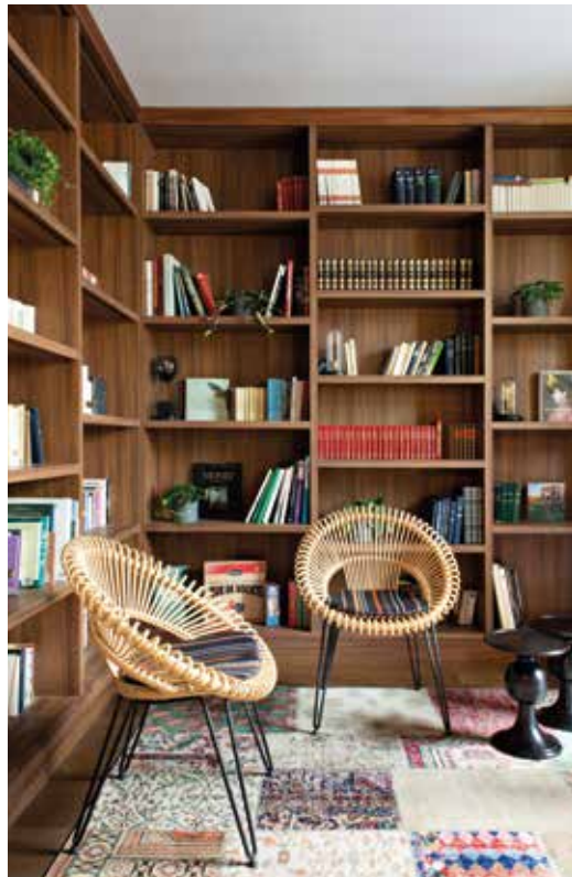
BIBLIOTHÈQUE _ Elle présente un mélange de styles, selon la volonté du designer de créer un lieu « à l'opposé des décors figés ». Les fauteuils en rotin sont signés Vincent Sheppard, les coussins Kvadrat et les tapis asymétriques Jean-Philippe Nuel.