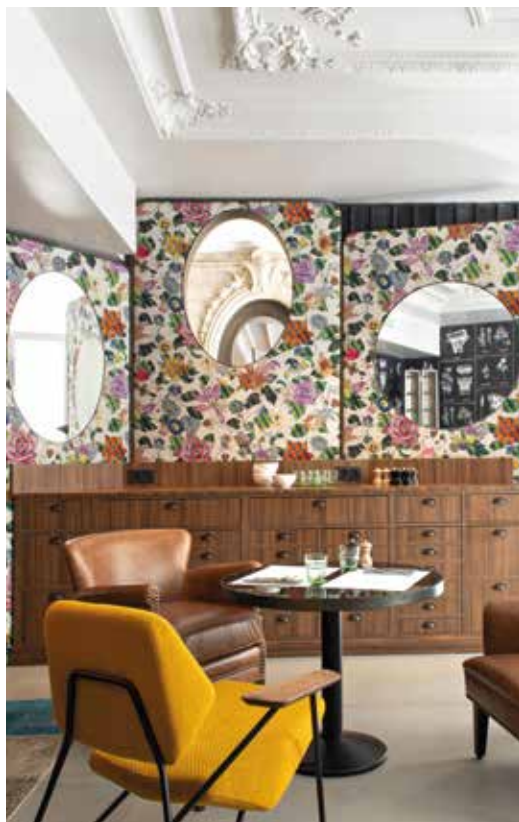
RESTAURANT _ Il est séparé du hall d'entrée par un mur-paravent fleuri, dans l'esprit du lieu. En écho au décor, le chef Edgard Prince privilégie la naturalité en mettant à l'honneur le Buddha Bowl.

Par Adine Fichot-Marion