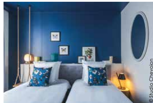
CHAMBRE _ Un mur bleu canard tranche sur le blanc pour créer un contraste chaleureux. Pour cultiver l'ambiance bucolique, des motifs de papillons, de fleurs... et une balançoire en guise de table de chevet.