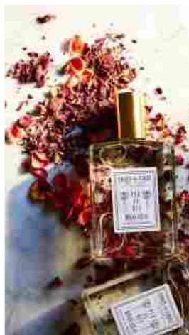
9 Coqui Coqui Residences, Yucatan e Bora Bora