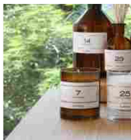
6 La linea dell'Hotel Magna Pars Suites