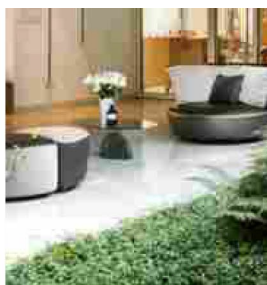
5 Hotel Magna Pars Suites, Milano