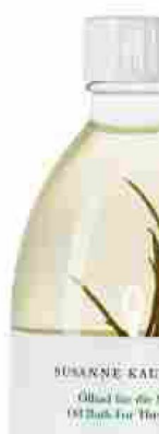
8 La linea Susanne Kaufmann, Hotel Magna Pars Suites,