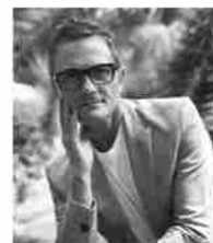
ICON PER PAOLO BECORA MILANO

Il 25 e 26 febbraio nel centro storico di Cervia la festa è dedicata