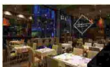
BASARA MILANO - VIA TORTONA