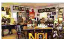
IL CIRMOLO - ANTIQUARIATO