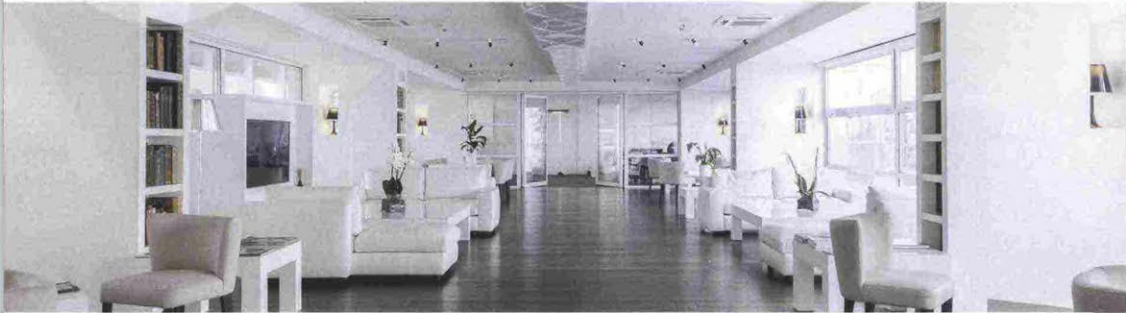
La library del Magna Pars Suites, hotel di Milano (via Forcella 6, magnapars-suitesmilano.it ): è lo spazio che ospiterà i talk e gli show cooking della F Design Week.

N ella prima settimana di aprile Milano è la città più cool e frizzante del mondo. Tutto succede qui, mostre, incontri, showroom e negozi aperti fino a tardi la sera, musica e aperitivi ovunque. È la festa del design che si celebra con il Salone del Mobile e il Fuorisalone. Quest'anno ci siamo anche noi, con uno spazio all'hotel Magna Pars Suites in via Forcella 6, in zona Tortona, al centro degli eventi più interessanti. Ecco cosa succederà.