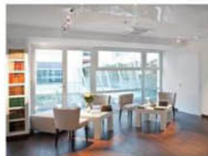
Ristorante Da Noi del Magna Pars Suites