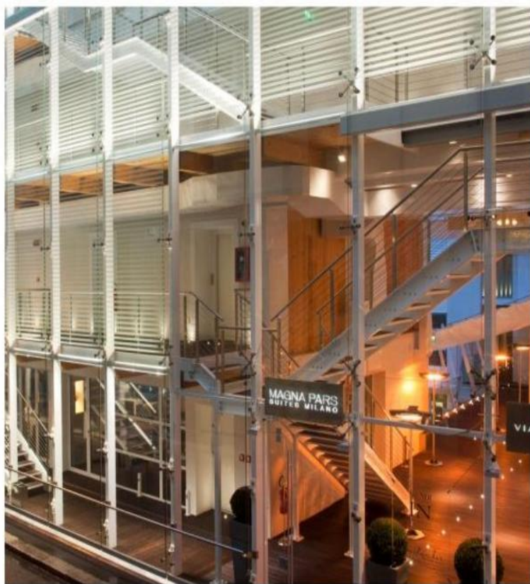
Il Magna Pars Suites Milano

Il 5 stelle sui Navigli nato da una fabbrica di profumi