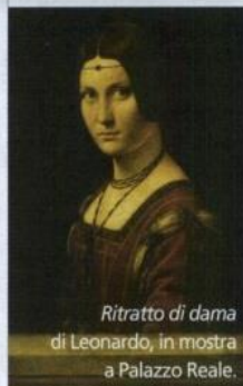
Ritratto di dama di Leonardo, in mostra a Palazzo Reale.

Il bacio di Hayez: il Bel Paese tra unità, gioventù e amore Pinacoteca di Brera, dal 4 agosto al 27 settembre