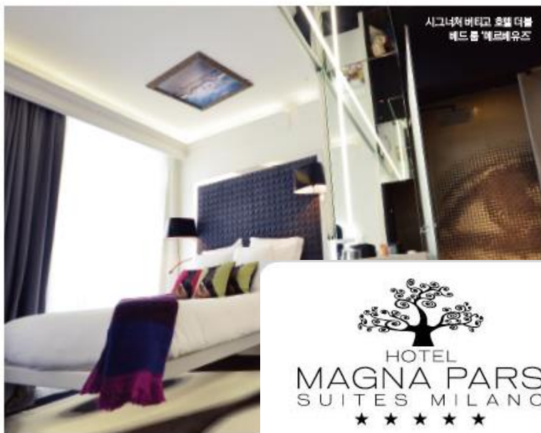
시그니처 버티고 호텔 더블 헤드룸 '레드룸' 예시

1박 숙박비(4월 1일 '리빙 헤드룸 코론 기준) 1백27유로 예약 디자인호텔스( designhotels.com )에서 예약할 수 있다. www.vertigohoteldjipn.com