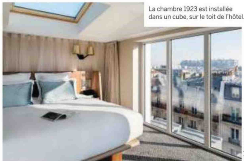
La chambre 1923 est installée dans un cube, sur le toit de l'hôtel.